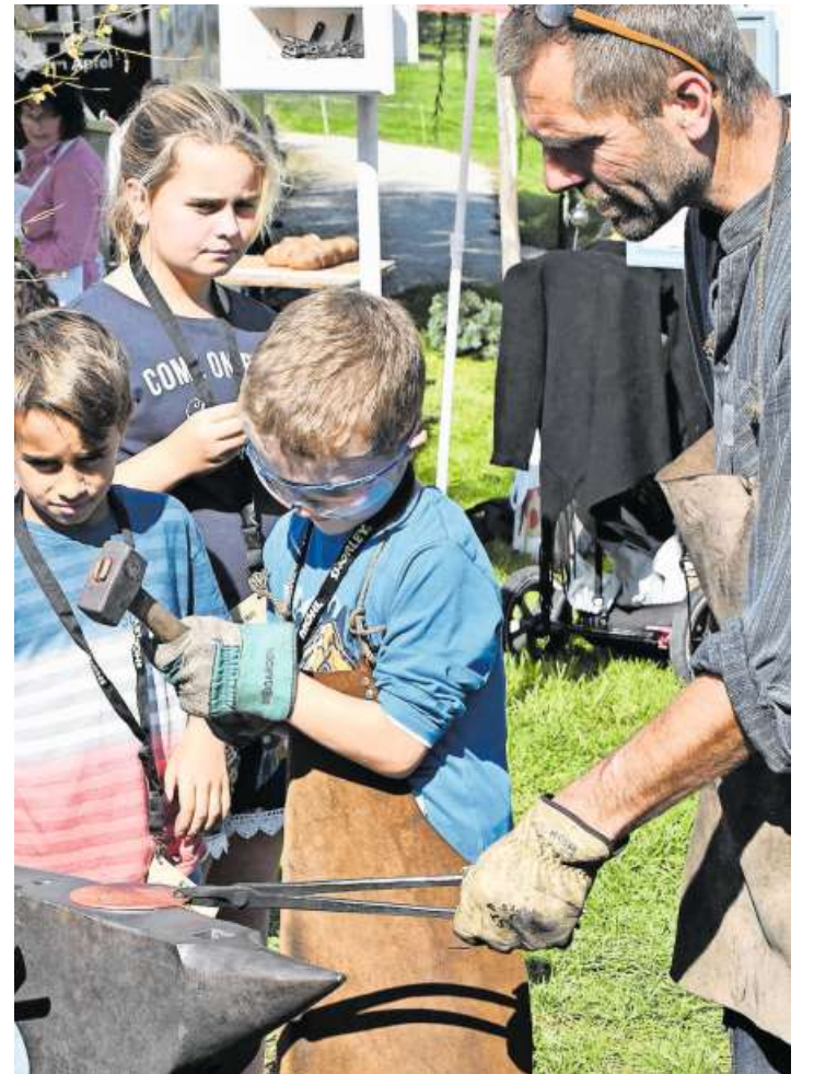
Bilder: Manuel Nagel