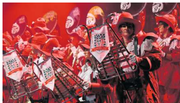
Die Glögglis am «Schälläfascht».