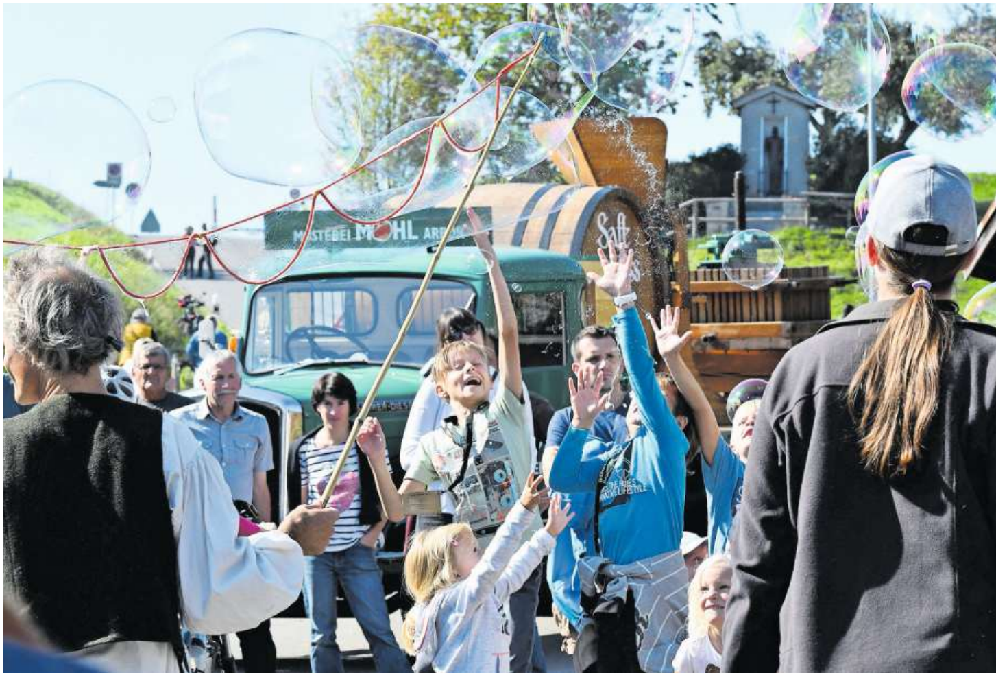
Die riesigen Seifenblasen des Gauklers erfreuen Kinder jeden Alters.