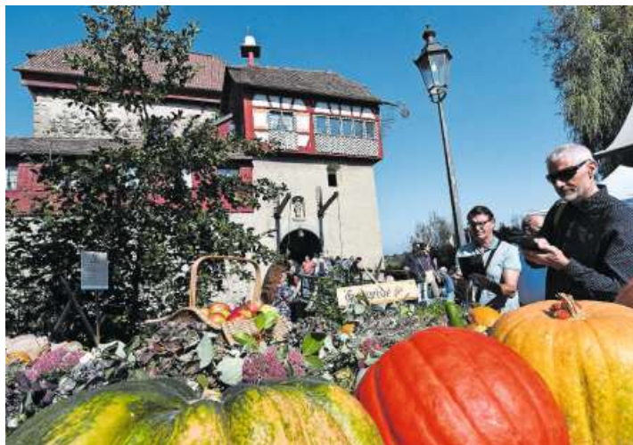
Die farbigen Kürbisse sind ein beliebtes Fotosujet bei den Besuchern.