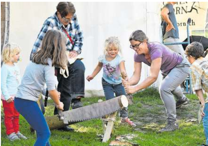
Bei den Mitmachangeboten kommt man hin und wieder ins Schwitzen.

Hagenwil Bei bestem Wetter feierte das Wasserschloss Erntedank – und mit ihm feierten Hunderte von Besuchern jeden Alters mit. Auf diese warteten rund 50 Marktstände, aber auch viele Mitmachangebote, wie etwa das Brotherstellen vom Mahlen bis zum Backen.